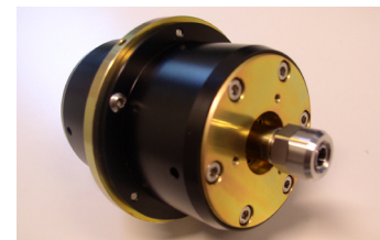
Le capteur MuT.02 utilisé pour la mesure du frottement à vide en rotation de compteurs d'eau.

Pour quantifier la valeur du couple résistif dans différentes configurations de montage, NRCtech a recouru à son capteur de couple MuT.02. Le capteur de couple MuT.02 est monté sur des paliers aérostatiques, ce qui le rend idéal pour la mesure de couple de frottement d'une valeur inférieure à 1.2 mNm.