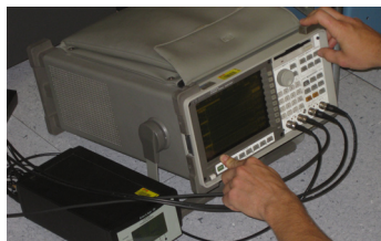
Acquisition de signaux pour l'évaluation des vibrations lors d'essais de démolition.

Certains équipements sont critiques et ne doivent pas être soumis à des vibrations d'une amplitude supérieure à un seuil donné. En utilisant des accéléromètres triaxiaux à haute sensibilité, NRCtech est en mesure d'enregistrer les vibrations générées par les travaux et d'en évaluer la criticité.